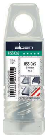
Drehpack mit Aufhänger Twistpack with tag Paquete giratorio con gancho para autoservicio

Oberfläche: blank Surface: bright Superficie: brillante